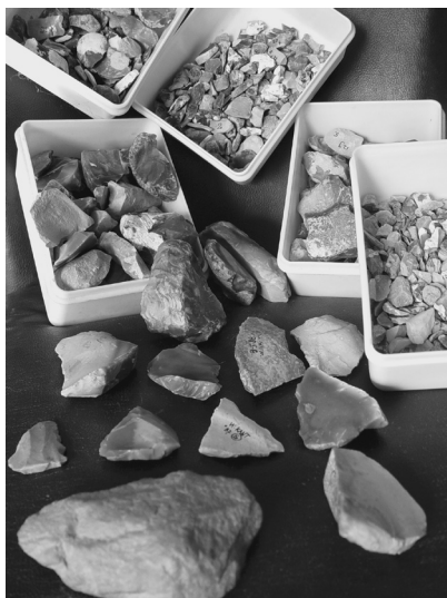
Artefacten uit de APAN-opgraving 'Schuilenburg'. Na een positieve expertise door wetenschappers van dit materiaal besloot Henk Kars om er in de winter van 1988/89 een officiële ROB-opgraving te starten. Die opgraving duurde drie weken. De resultaten daarvan zijn nooit gepubliceerd. De driehoekige spitschaven en de schaaft rechtsvoor werden tot 'incerto facto' verklaard. Foto en tekst: K.G.